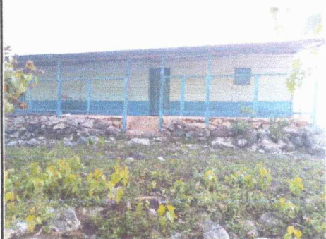
Foto 3: Pintura en muros interiores y exteriores del centro educativo.